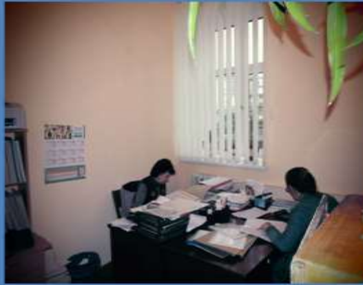
Кабінет головного бухгалтера