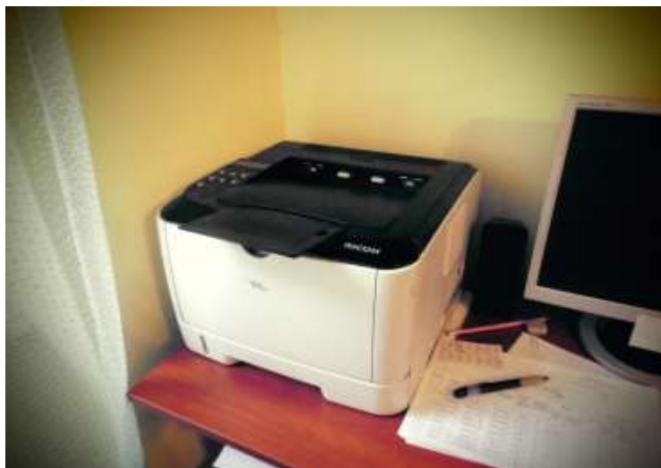
Принтер на суму 2,90 тис.грн.