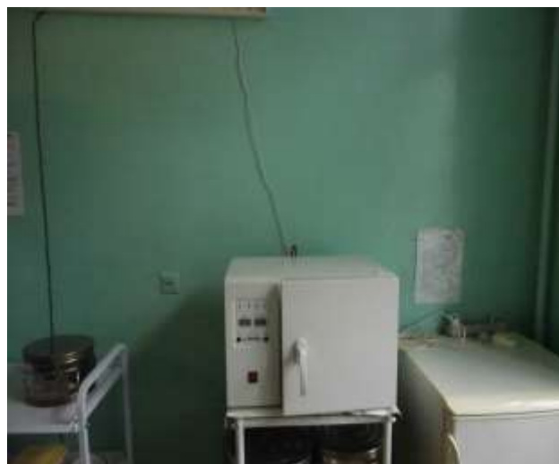
Сухожарова шафа ГП-20 на суму 6,90 тис.грн.