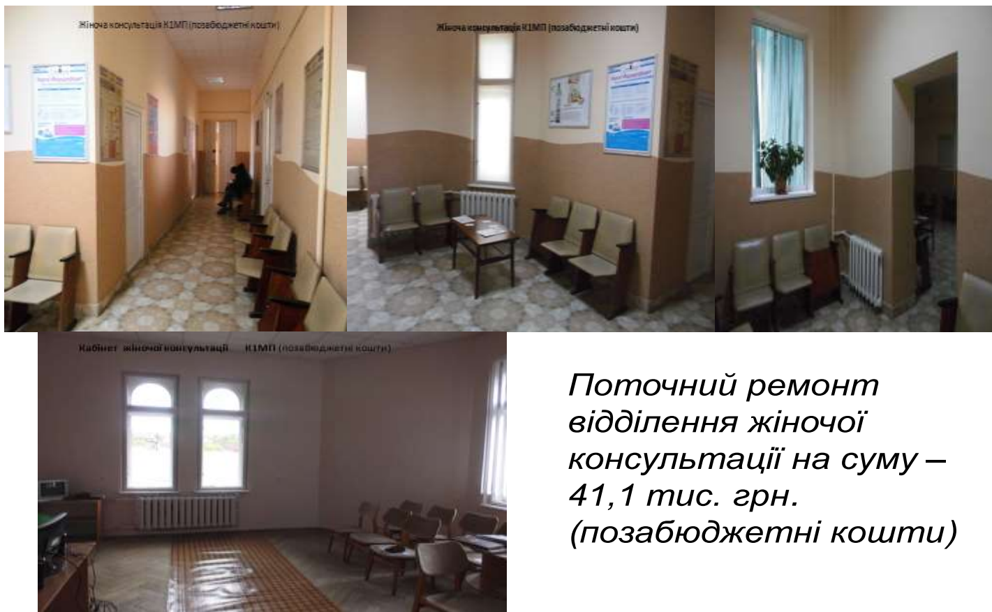
Фото проведених ремонтів та придбання медичної та немедичної апаратури та ін. за 2016 рік

Поточний ремонт відділення жіночої консультації на суму – 41,1 тис. грн. (позабюджетні кошти)