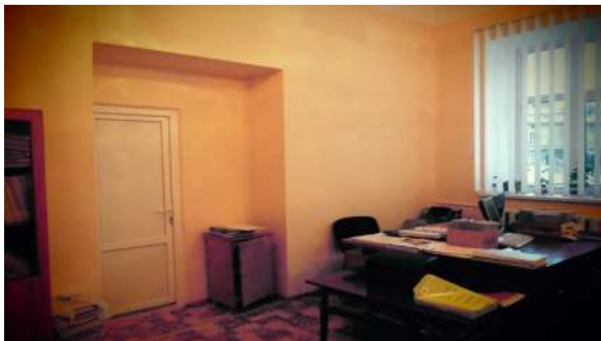
Коридор при вході в ЦБ №1

Встановлено 4 шт. дверей в ЦБ №1 за позабюджетні кошти на суму 15500 грн.