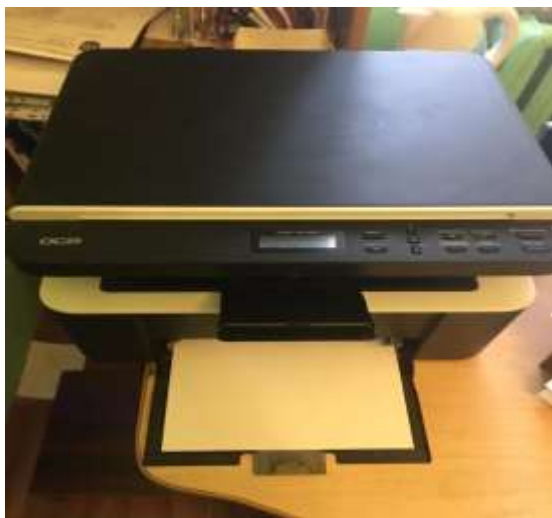
Багатофункційний принтер на суму 3,40т.грн.