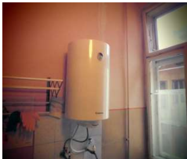
Бойлер 80л на суму 2,55 тис.грн.