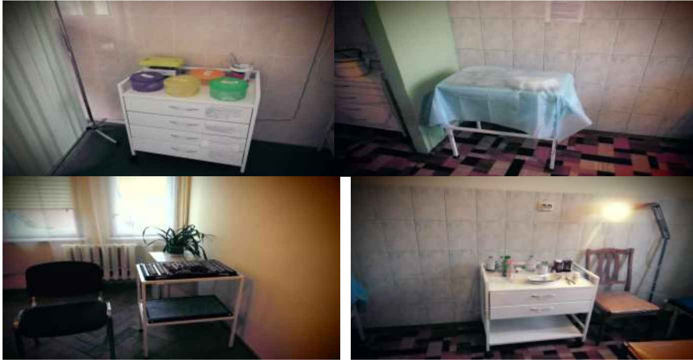
Стілець гвинтовий медичний – 4 шт. на суму 7,448 тис.грн.