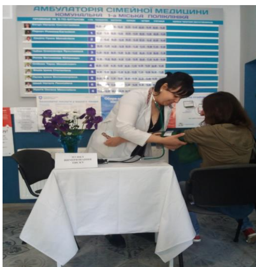
Проведення акції за адресою м.Львів, вул.Римлянина,2