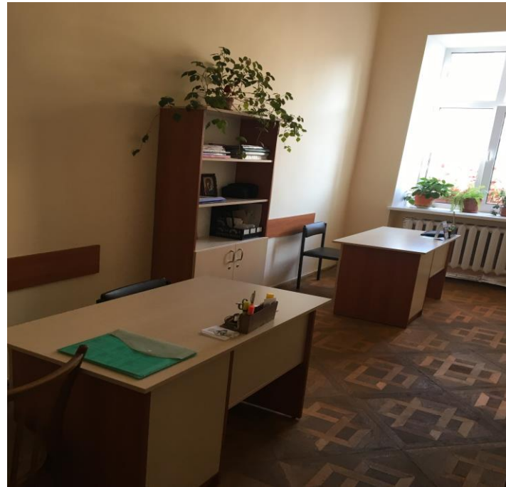
Кабінет старшої сестри медичної (вул.Римлянина,2)